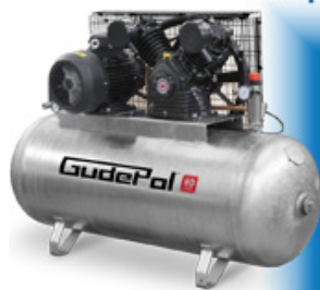
kompresor tłokowy HD