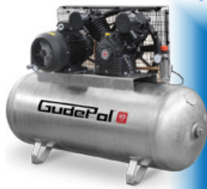
kompresor tłokowy HD